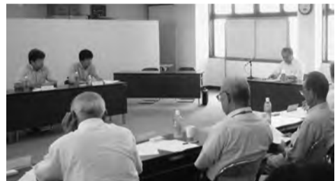
小規模企業振興委員連絡会議にて市の商工業施策の説明を受ける振興委員