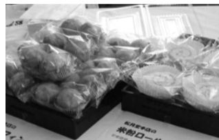
米粉ロールケーキ・米粉マフィン

作る米粉パン・菓子も来場者に人気を集め、モチモチした食感などがはじめて食べる人の好奇心をそそっていた。