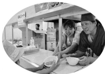
市原産の米粉と古代米(赤米)をブレンド 夜明けの空の色をイメージした米粉サラダうどん

て参加した。このイベントの目玉である「米粉うどん巡り」は、ホウレン草やヨモギなどを米粉にブレンドした米粉うどん、中華風の米粉冷麺、アジア風の米粉フオーなども出揃い米粉うどんが色