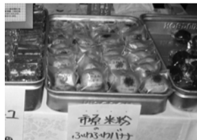
市原米粉のふわふわバナナ