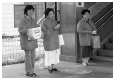
五井駅西口にて、節電PRと義援金募金活動を行う女性会メンバー

広域事業ブロック活動とは、環境・教育等をテーマに女性会活動を推進及びアピールすることを目的に昨年度から始まった活動である。