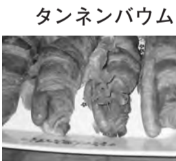
市原の肉・パン・レタスで ホットドック