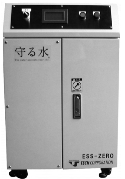
ESS-ZERO(タンクレス) 水道直結、可動式タイプ

後者の電解水衛生環境システムは、水道水に含まれているカルキや有機塩素化合物、臭気、チリ、