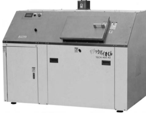
TECH-400-A2 35kg/日 処理タイプ

ラチナ触媒式脱臭装置により問題はクリアされている。処理後の残渣は堆肥化され、食品廃棄物の再生利用などが義務付けられている食品リサイクル法に対しても効果を発揮することから食品関連業者からの引き合いが多い。2007年の法改正により2012年までの食品リサイクル実施率の目標値が引き上げられていることもあり当機器への注目度は益々高く